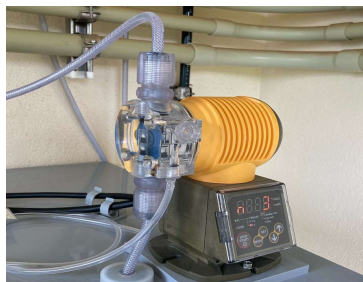
塩素消毒（滅菌）設備