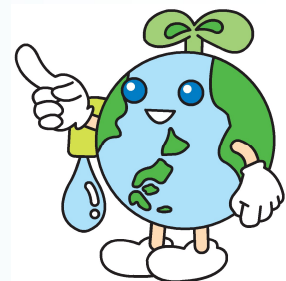
企業団すいどうキャラクター 「アースイ」

この水質検査をどのように行うかを、お客さまに広く知っていただくため、検査する場所や項目、頻度などについて記したものが水質検査計画です。