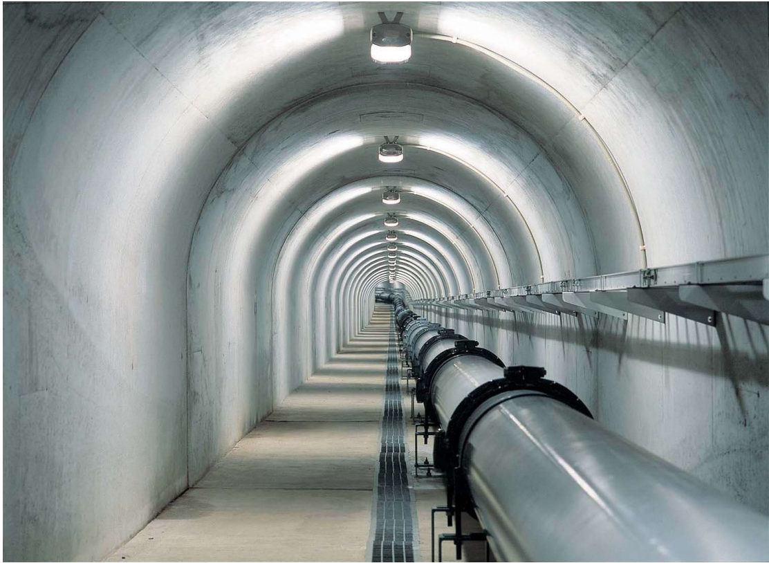
立野水源（ずい道）延長 790m