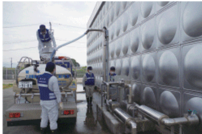
水を配水池から給水車へ