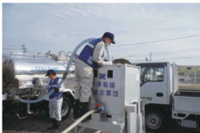
給水タンクへ補給