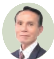
山本 富二夫 議員

新聞に竜門ダムの工業用水を菊池地域のIC企業へ給水に活用できないか出ていた。メガソーラーの乱立、水田の減少など、地下水涵養は減少傾向にあると思われる。水質の管理上問題があるが、上水道としての活用は今から検討すべきではないかと思うが企業長の考えをお尋ねしたい。